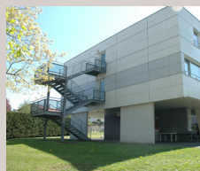
EHPAD A. Pinay