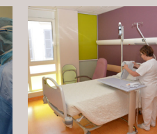
Chambre de chirurgie ambulatoire