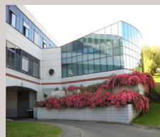
Centre de rééducation MARREL