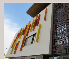
I.F.S.I. - I.F.A.S.