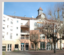
EHPAD L'Orée du Pilat